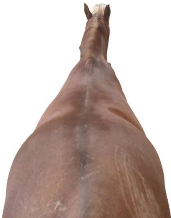
Photo prise au-dessus, cheval carré, tête dans une position droite et naturelle.